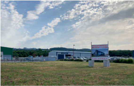
Zone d'activité économique de la Lauze à Bout du Pont de l'Arn

Une zone d'activité économique est un site réservé à l'implantation d'entreprises. Depuis le 1 er janvier 2023, la gestion des zones d'activité économique relève de la compétence de la CCTMN. Elles sont donc désormais définies, aménagées et gérées par la Communauté de communes. Par délégation, les communes continuent d'effectuer l'entretien courant.