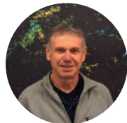
ALAIN AMALRIC Rouairoux