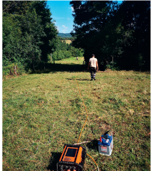
Réalisation de l'étude géophysique, août 2023

Cela a mené à l'identification de deux secteurs, l'un sur Albine, l'autre sur Lacabarède. La prochaine étape est d'y réaliser des essais de forages pour estimer la quantité d'eau présente dans les sous-sols (à environ 100 m de profondeur). Ces forages d'essai seront réalisés durant l'année 2024.