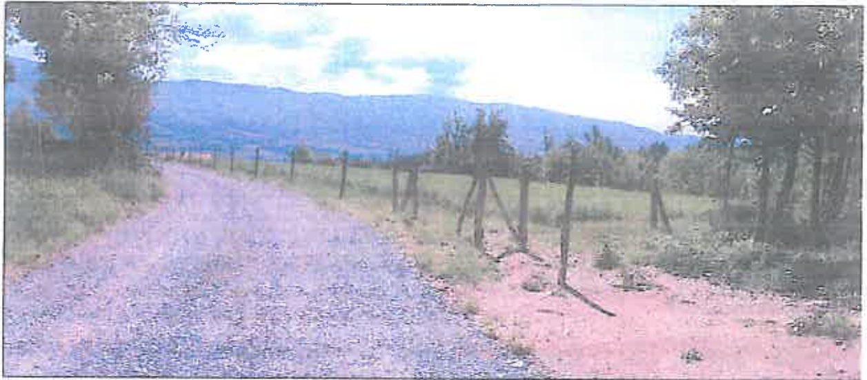
La prairie au sud