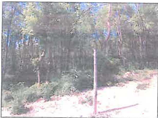
Le taillis dans sa partie ouest