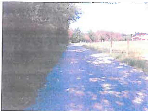
La lisière du taillis en bord de chemin

Le site d'extension de la zone NB s'inscrit dans la continuité d'un habitat pavillonnaire réalisé de manière diffuse. Les évolutions récentes en matière de plantations montrent d'une part un renforcement de la végétation arbustive lorsqu'il y a déprise agricole prolongée, d'autre part une disparition du couvert boisé.